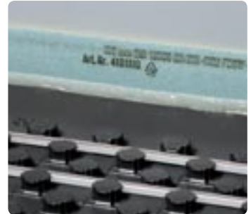
Uitvlakelement bij wandaansluiting

Met de koppelstrook wordt de montage van Uponor Tecto nog flexibeler. Zo worden reststukken overeenkomstig de bestratingmethode tijd- en snijafvalbesparend zonder zelfoverlapping aangebracht, eenvoudig op de maxi-noppen drukken.