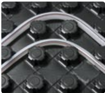
Het Uponor Tecto 2 element maakt een kleine buigradius mogelijk

Het Uponor Tecto uitvlakelement niet alleen voor de deurovergang een snelle oplossing. Het is ook ideaal voor dilatatievoegen op zeer grote oppervlakken of bij de wandaansluiting zoals hier in de 90° versie. De folie van de randisolatiestrook ligt tussen het isolatie-element en de afdekfolie – met name aan te bevelen voor gietvloeren.