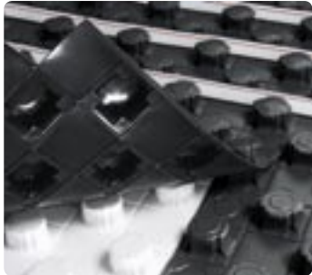
Overlappende Uponor Tecto 2 elementen

De clou van de Tecto elementen zijn de noppen. De afdekfolie waarborgt enerzijds een schone en eenvoudige montage door de maxi-mini-noppen en verschaft anderzijds optimale dichtheid door de overlapping.