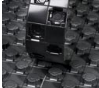
De koppelstrook wordt ingezet

De clou van de Tecto elementen zijn de noppen. De afdekfolie waarborgt enerzijds een schone en eenvoudige montage door de maxi-mini-noppen en verschaft anderzijds optimale dichtheid door de overlapping.