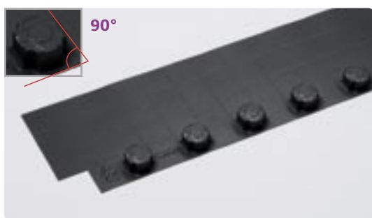
Het Uponor Tecto uitvlakelement 90° versie