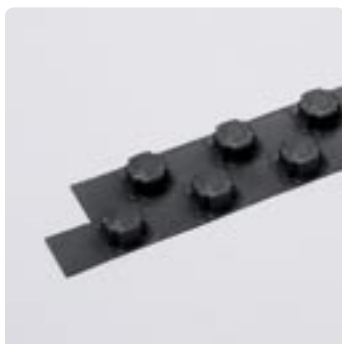
De Uponor Tecto koppelstroken