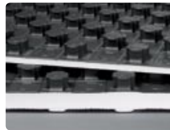
Uponor Tecto noppenplaat in de nominale dikte ND 11 dan wel ND 30-2