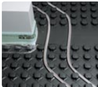
Deurovergang met uitvlakelement

Uponor Tecto is afgestemd op de veelvuldig geteste Uponor Velta PE-Xa leiding volgens procédé Engel. De afmetingen 14 en 16 mm zijn zuurstof-diffusiedicht volgens DIN 4726. Dankzij de zeer grote flexibiliteit is een snelle en arbeidsvriendelijke montage zelfs bij de kleinste buigradius binnen de normen gewaarborgd.