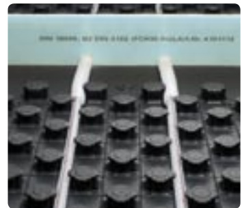
Leidinginstallatie met dilatatieprofiel

Overgangen tussen ruimten zijn snel gemaakt. Aangezien het uitvlakelement in het vlakke gedeelte geen noppen heeft, leidt dit automatisch tot een goed verloop van de flexibele verwarmingsleiding. Moeilijke deurovergangen behoren daarom tot het verleden.